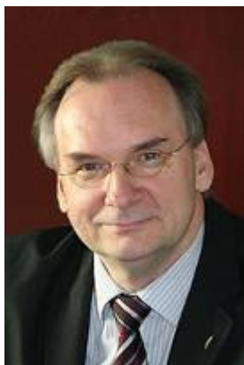
Dr. Reiner Haseloff

mit dem Präsidenten des Europäischen Chemieregionen Netzwerkes (ECRN) und mit dem Minister für Wirtschaft und Arbeit des Landes Sachsen-Anhalt