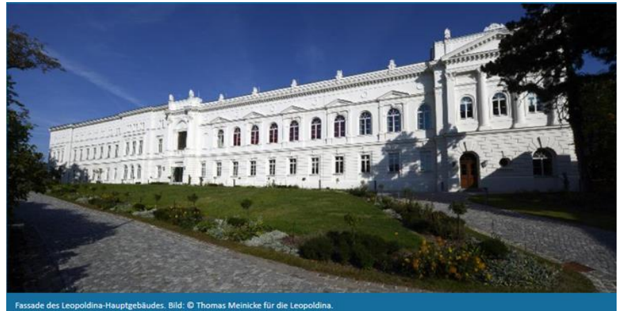
Fassade des Leopoldina-Hauptgebäudes.