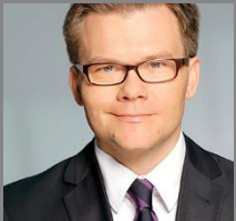
CARSTEN SCHNEIDER Staatsminister & Beauftragter der Bundesregierung für Ostdeutschland